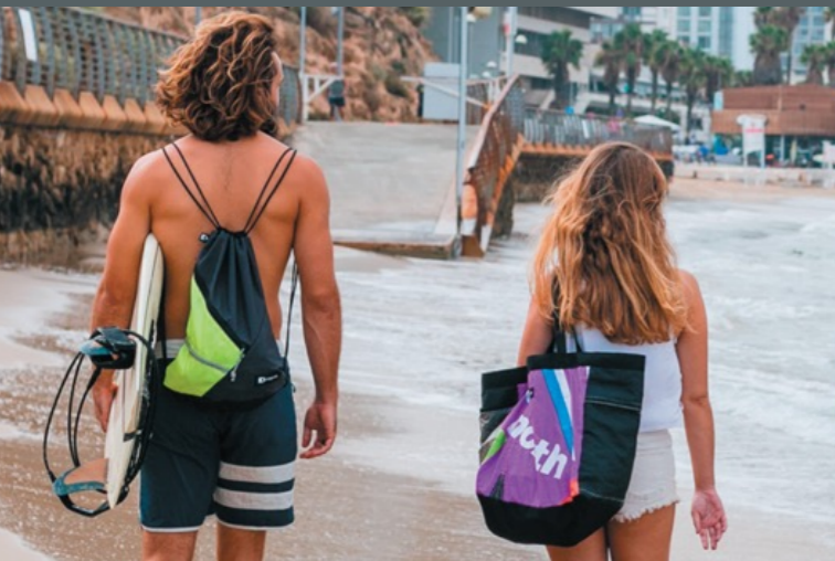
Kitepride produziert Taschen in Tel Aviv/Israel

NG-Mitarbeiter und Alumni organisieren Hilfe für Gemeinden in Kuba, die gezielt Menschen helfen, welche von der Inflation besonders betroffen sind.