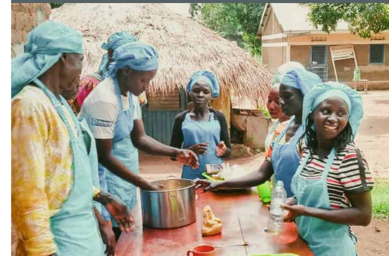
Kochkurse in Yei/Südsudan

NG unterstützt den Wiederaufbau zerstörter Schulgebäude und eine Anzahl von Berufsbildungskursen vor allem für Frauen und Mädchen.